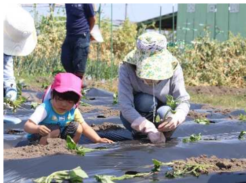
ふれあい農園での食育活動