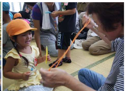
ふらっとほーむののぼり