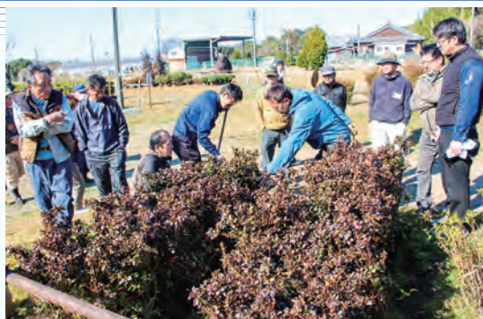
活発な競りが行われた春季大市

会場には、植木生産者から鈴鹿市の特産であるサツキやツツジ類を中心に高品質な植木120点が出荷されました。当日は、植木を求めて県内外から訪れた卸売業者や造園業者など買請人約15人が訪れ、賑わいを見せました。