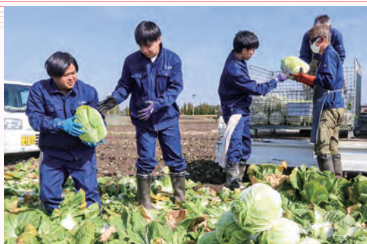
収穫作業を経験する若手職員

当日は、ハクサイの収穫と出荷調整作業を体験しました。参加した職員からは「ハクサイが商品として店頭で並ぶまでにたくさんの苦労がある。少しでも生産者の気持ちを理解していきたい。」と話し合いました。