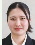
まんじゅう あたえ 満仲与愛