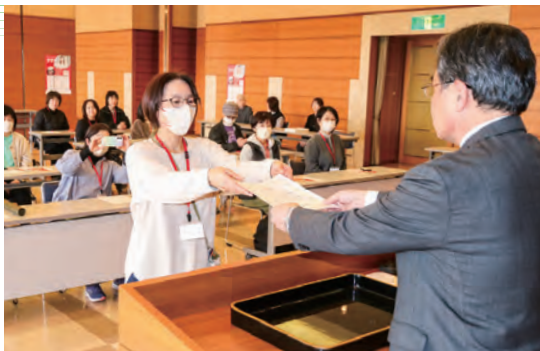
林常務より修了証書を受け取る受講生