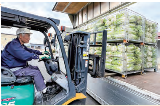
鉄コンテナ出荷されたハクサイを運ぶ運送業者