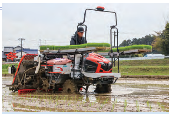
管内各地で田植えがはじまりました

3月下旬、JA鈴鹿管内で水稻の田植えが始まりました。当JA管内では、約2,750haの面積でコシヒカリ、キヌヒカリ、あきたこまちなどの品種が中心に栽培されています。4月下旬に田植えの最盛期をむかえ、8月上旬に収穫期を迎えます。