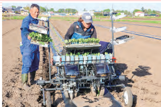
乗用定植機で省力化に取り組む生産者

部会では、ペーパーポットで育苗した苗を定植機で定植するなど省力化に取り組むとともに株間を狭めて密植し、収量増加を目指します。収穫は7月中旬からを予定しています。