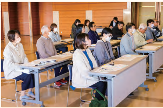
生産者として第一歩を踏み出した受講生