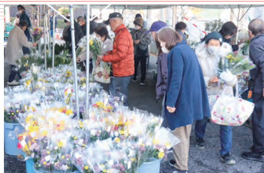
切花を選ぶ来店客

店外販売日は通常営業日と比べて約2倍近い来店客が訪れ、開店前から花を買い求める多くの人で賑わいました。切り花の店外販売は、盆と正月の需要期に合わせて開催しています。