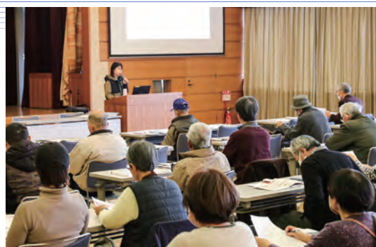
講師の解説に耳を傾ける参加者

研修では三重県中央農業改良普及センターの職員を講師に招き、果樹全般における病害虫防除をテーマに、防除の基本から主要な害虫被害の特定による効果的な対策、近年問題となっている外来種被害の特徴について学びました。当JA管内では、栽培をはじめと問もない生産者も増えていることから今後も研修会の開催や圃場巡回を通じた栽培指導で生産者を支援していきます。