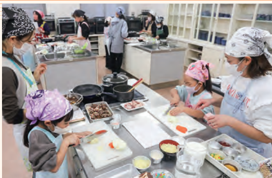
協力して調理する親子