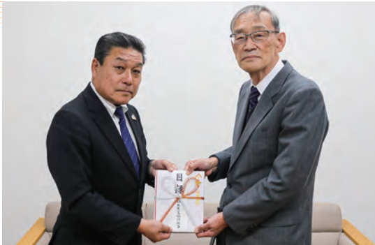
目録を手渡す平子専務(左)と亀山市の榎谷会長(右)