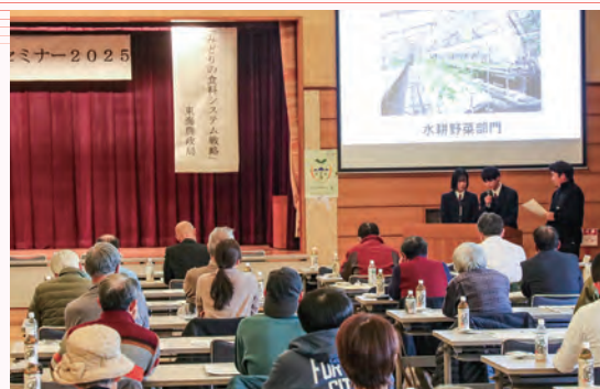
取組みを発表する四日市農芸高等学校の生徒

セミナーでは、東海農政局が「みどりの食料システム戦略」の具体的な内容について説明したほか、相可高等学校が「バイオマス発電廃棄物の農業利用〜栽培から商品企画まで生徒が手掛けたバイオバジルオイル」、四日市農芸高等学校が「地域資源を活用した持続可能な鶏卵生産〜産学連携で地域資源にのりを〜」と題して取組み内容と成果を発表しました。