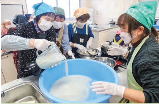
こんにゃく芋をミキサーで攪拌した参加者