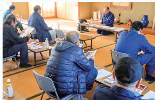
良質米の収穫に向け、話し合いました

研修会では、営農経済渉外員が昨年産米の栽培管理についての反省と令和8年産の水稻栽培に向けた管理方法や資材の適切な使用方法など栽培のポイントを説明し、良質米の収穫を目指し、生産者と話し合いました。