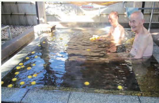
ゆず湯を楽しむ来場者