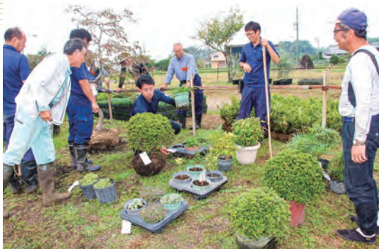
市を仕切るセリ人(右から2人目)と買請人