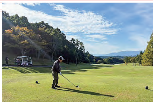
親睦を図り、交流を深めました

大会は、共通の趣味を通じて会員同士が親睦を図り、交流を深めることを目的に開催しています。近年では女性の参加者も増えて賑わいを見せています。競技中は声を掛け合い、ラウンドして交流を深めました。