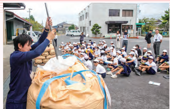
米検査を実演する営農指導員

当日は、出荷されたお米が保管される米倉庫の見学や当JA営農指導員による米検査作業の実演からJAに出荷されたお米が流通していくまでのプロセスについて理解を深めました。