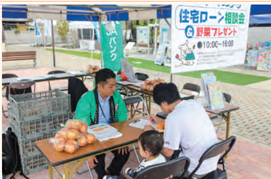
来場者のニーズを伺うJA職員