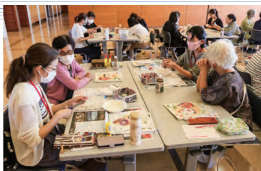
支部長から制作方法を教わる受講生

今回の講座では管内で活動する女性部支部長など15人が作り方の指導役として参加し、制作方法を伝えながらコミュニケーションを図り、女性組織間の垣根を越えて交流を深めました。