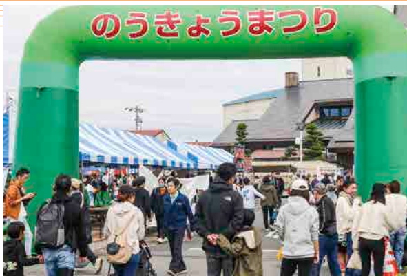
たくさんのご来場ありがとうございました