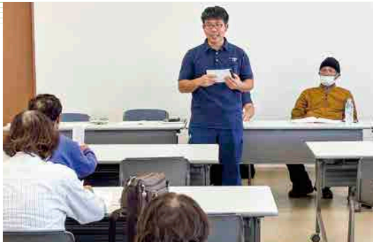
出荷時の注意点について説明する当JA職員