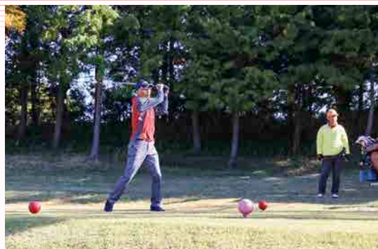
アクティブライフ倶楽部会員の華やかなスイング

大会は、共通の趣味を通じて会員同士が親睦を図り、交流を深めることを目的に開催しています。近年では女性の参加者も増え、賑わいを見せています。競技中は互いのプレーを褒めるなど声を掛け合いラウンドして交流を深めました。