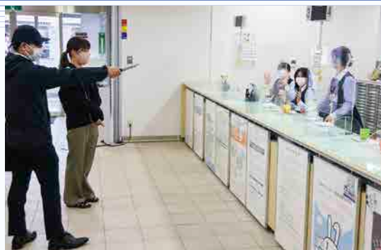
ナイフを持ち、強盗役を演じる警察署員

訓練では強盗役の警察署員がナイフを持って来店客役の職員を人質に取り、バックに現金を入れるよう脅し、現金を奪ったあと逃走するという想定で行われました。対応した支店職員は、非常通報ボタンを速やかに押し、犯人の特徴の確認、人質の保護など実践を想定した訓練を行いました。