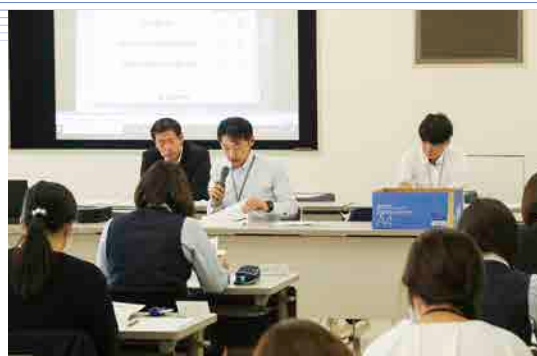
個人情報の適切な管理とコンプライアンスの徹底に努めています

研修は、不正や不祥事の未然防止への意識醸成を図ることを目的として個人情報取扱いの重要性を鑑み、個人情報の適切な管理とコンプライアンス(法令遵守)を徹底し、利用者が安心して事業を利用できるよう指導しました。