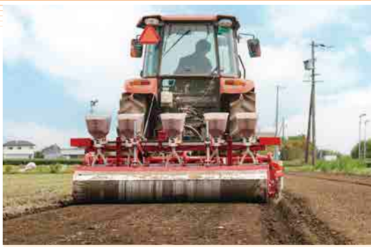
播種作業を行う生産者