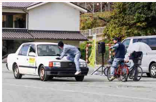
事故を再現するスタントマン

11月27日、当JAとJA共済連三重は三重県警察本部と連携し、亀山中学校でスタントマンによる自転車交通安全教室を開催しました。スタントマンの実演から事故の衝撃や恐さを実感し、交通違反を無くして事故を未然に防ぐことが目的です。生徒らが見守る中、携帯電話を掛けながらの運転や二人乗り、飲酒、傘さし運転など様々な危険運転を演じて自転車と自動車の事故を再現し、危険性と交通ルールの順守を訴えました。