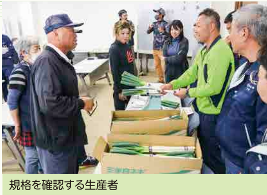
規格を確認する生産者