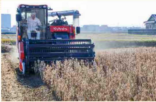
管内各地で大豆の収穫が始まりました