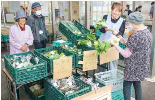
来店客に野菜を販売する受講生