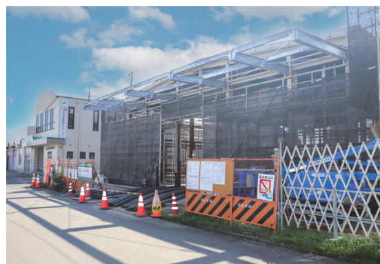
現在、建設中の東部営農・資材センター倉庫