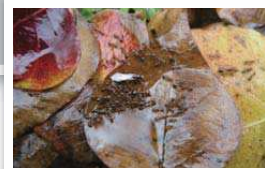
葉っぱの上のヒアリ