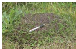
ヒアリが作る大きなアリ塚