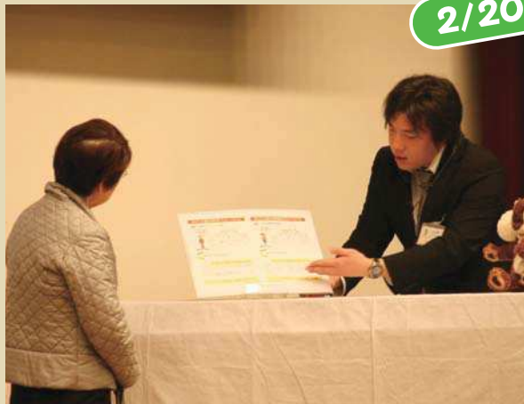
▲ フリップを使い説明する窓口担当者