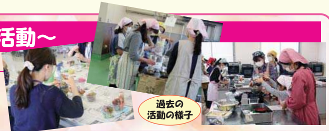
過去の活動の様子

「健康」「教育」「料理」等身近な話題をテーマに年間で4回の活動を予定しております。興味のある方はぜひご参加ください。第1回講座は6月11日(土)午前10時~12時焼肉のタレ作り体験教室を予定しております。