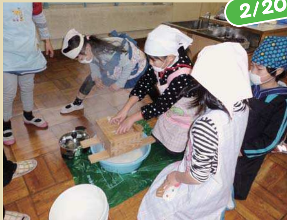
▲ 上から重みをかけ成型する児童