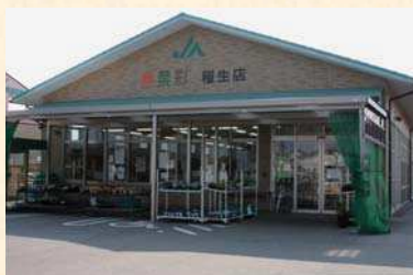
稲生店 鈴鹿市稲生2丁目17-17 ☎ 059-380-0831