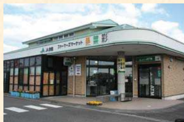
鈴鹿店 鈴鹿市地子町1268 ☎ 059-381-0831

沢山買って沢山食べてサミットを盛り上げましょう!! 食の「安心安全」「地産地消」を推進する果菜彩でお待ちしております。