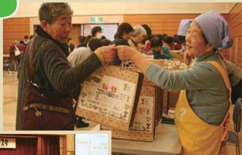
▲ 商品詰め合わせセットが人気でした